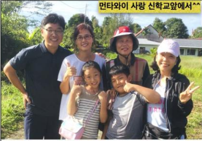
먼타와이 사랑 신학교앞에서^^