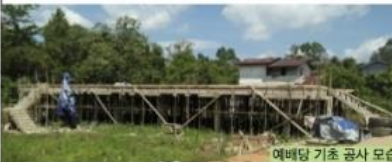
예배당 기초 공사 모습

2. 다릿교회 예배당 건축: 올해에도 인천선두교회(담임:곽수관 목사님)에서 현지교회 건축 지원을 해주셨습니다. 지난 5월 초에 공사가 시작되어 현재 기초공사가 한창 진행중에 있습니다. 이번에 건축되는 다릿교회는 읍내교회로서 앞으로 지역 거점교회의 역할을 감당하게 될 것입니다.