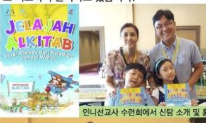
인니어선교사 수련회에서 신탐 소개 및 홍보

올해 상반기 저희 사역 가운데 놀라운 일들이 있었는데 그 중에 하나가 인도네시아 교회 주일 학교에 파이디온 선교회의 신나는 성경탐험(신탐) 교재를 번역출판하는 일입니다. 파이디온 협력선교사로 있었지만 사실 교회 개척사역에만 집중하고 있었던 저희 가정에게 하나님께서 7-8년 전에 번역해 놓은 신나는 성경탐험을 인니어로 번역출판하는 일을 시작하게 되었습니다. 이 일을 위해 한국에 파이디온 선교회를 방문하고 현지 출판사와 만나는 등 바쁜 시간을 보냈습니다. 현재는 월드티치 인도네시아와 함께 향후 “성경탐험” 교사용 교재와 어린이 교재를 출판하는 일을 논의하고 있는 상황입니다. 앞으로 이 교재를 통해 인도네시아 교회와 주일학교, 기독교에 광범위하게 사용될 것을 꿈꾸며 수 많은 아이들이 성경을 큰 그림으로 배우며 하나님을 알아가는 지식이 더욱 커지기를 간절히 바라는 마음으로 기도하며 준비하고 있습니다.