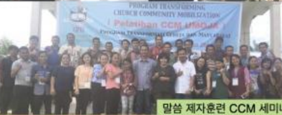
말씀 제자훈련 CCM 세미나