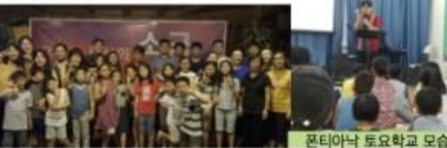
폰티아낙 토요학교 모습

9. 폰티아낙 토요학교 교정: 올해 하반기부터 6개월 동안 폰티아낙에 20여명의 한인 아이들이 함께 예배하고 성경을 배우는 토요학교 교정으로 섬기게 되었습니다. 예수님 안에서 기쁘고 즐겁게 토요학교를 이끌어 갈 수 있도록 기도부탁드립니다.