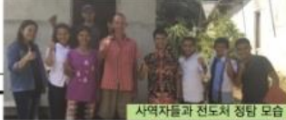
사역자들과 전도처 정탐 모습

3. 3개 마을 전도처 준비: 현지 성도들의 소개로 곱바안과 따안 지역들을 정탐하며 주민들을 만나고 전도처 개척을 타진하고 있습니다. 감사하게도 다릿 지역에 3개 마을이 전도처로 개척되어 이번에 정탐을 통해 새로운 마을들을 많이 알게 되었습니다. 앞으로 곱바안 지역과 따안지역에 전도처들이 많이 개척되어 새롭게 들어오는 졸업생과 실습생들이 곧바로 사역지에서 사역할 수 있도록 배치할 예정입니다.